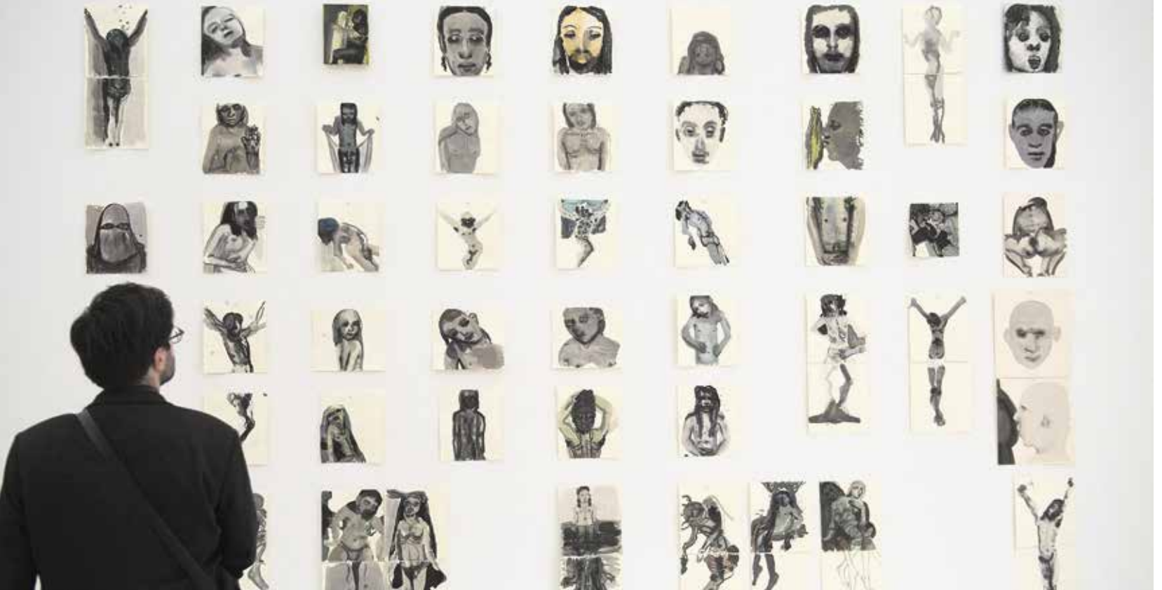
«Auf der Suche nach dem perfekten Liebhaber», eine Werkserie von Marlene Dumas in der Fondation Beyeler.