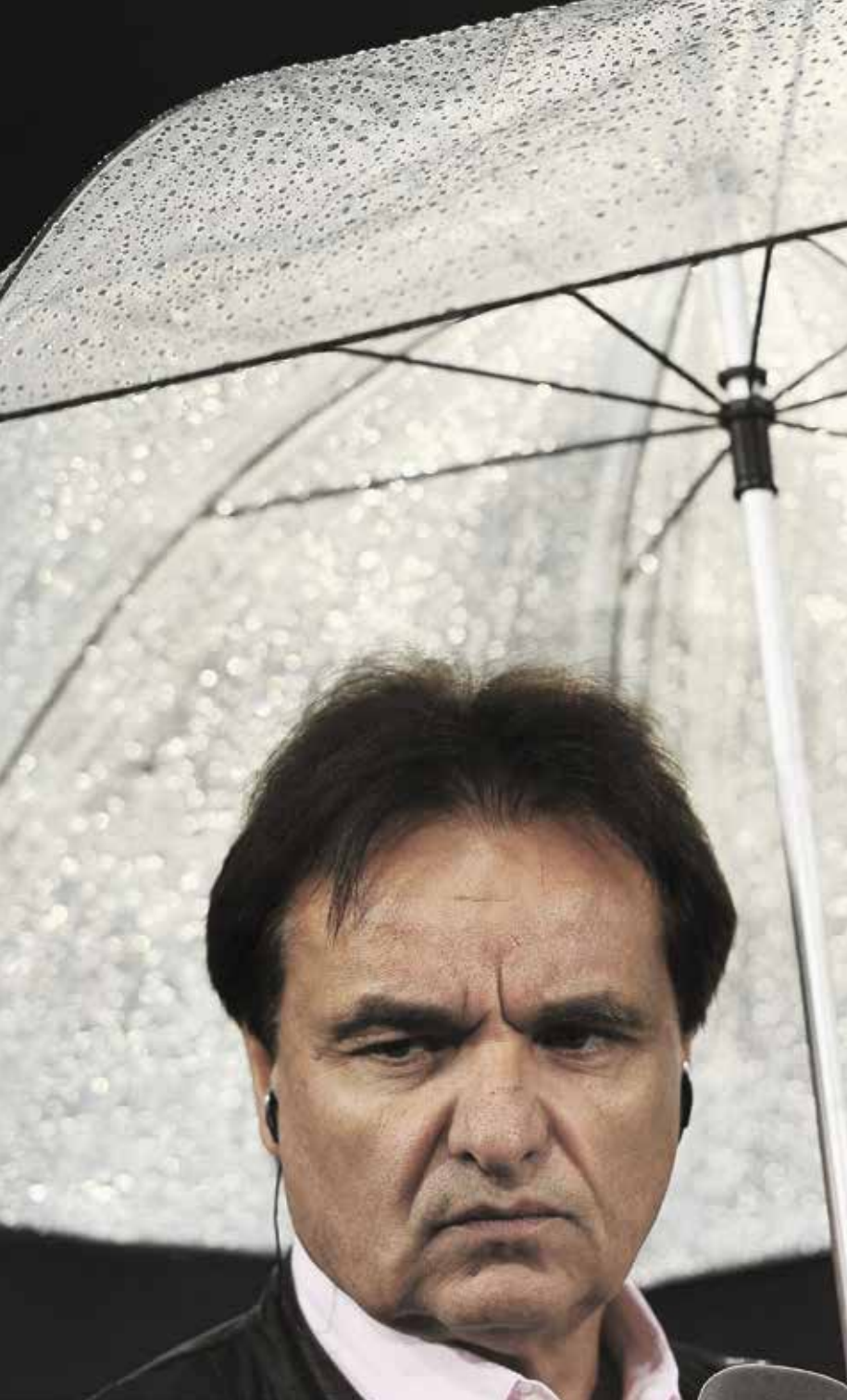
«Basel ist Favorit.» Doch das waren andere Finalgegner des FC Sion auch.

mit je acht Teams in der Super League und der Challenge League. In der Super League brauchen alle Vereine ausser Basel einen Mäzen. Und was die Vereinsspitzen betrifft, gibt es viele Wechsel. Nehmen Sie GC, die haben in drei, vier Jahren vielleicht sechs Präsidenten gehabt, ich habe die Zahl nicht exakt im Kopf. Und da reden wir von den Grasshoppers, einer Institution im Schweizer Clubfussball. Früher hatte man mit GC, dem FCZ und YF Juventus drei Zürcher Mannschaften in der Nationalliga A, heute haben sie Mühe, überhaupt einen einzigen wirtschaftlich gesunden Verein zu führen.