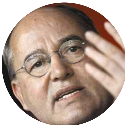
Gregor Gysi ist deutscher Rechtsanwalt und Vorsitzender der Linksfraktion. Mehr von ihm auf der Website «Die Linke». tageswoche.ch/+oea7a

Indessen gibt es gute Gründe, die GDL und ihre Konfliktbereitschaft zu loben. In Deutschland sind Produktivitätsentwick-