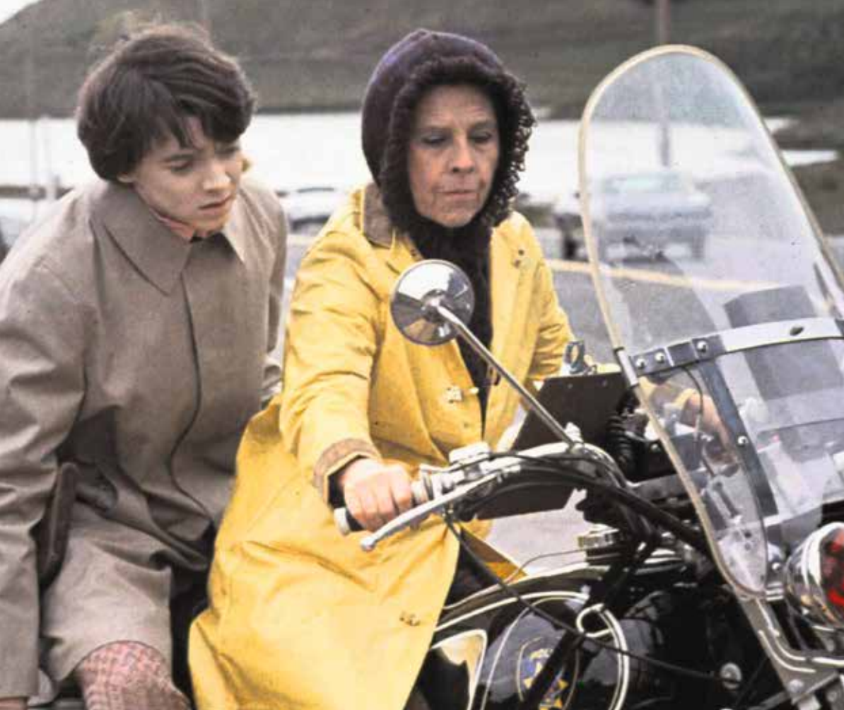
Eine Liebesgeschichte über Generationen hinweg: «Harold and Maude».