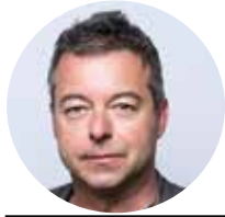
Remo Leupin Leiter Print