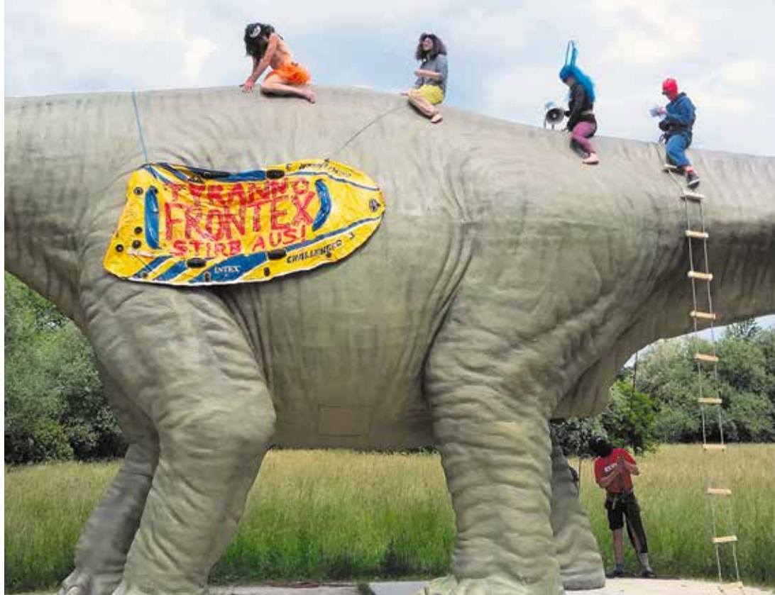
Die Protestierenden von Atopie machen auf ihre Forderungen aufmerksam.