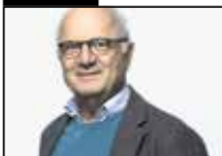
tageswoche.ch/ themen/ Georg Kreis