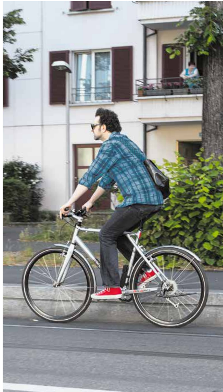
Eng: 73 Zentimeter fürs Velo.