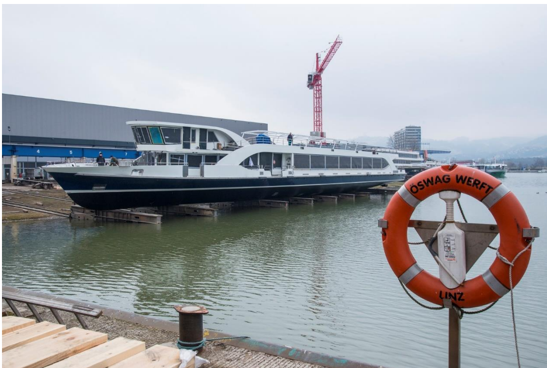
Das neue Basler Personenschiff während der Einwasserung in Linz (AT)

Der Baubeginn des Schiffes erfolgte nach der Kiellegung im Mai 2017 in der Werfthalle der ÖSWAG WERFT AG in Linz (AT). Bis zum Ende des letzten Jahres haben sich die Arbeiten auf die Erstellung des Schiffsrumpfes konzentriert. Anfangs 2018 konnte dann der Innenausbau und der Einbau der Technik in Angriff genommen werden. Mit der Einwasserung und dem damit verbundenen Abschluss der Aussenarbeiten konnte am heutigen Tag ein wichtiger Bauabschnitt erfolgreich abgeschlossen werden. Während mehreren Stunden wurde das aktuell 460t schwere Schiff über die sogenannte Slipanlage ins Wasser gelassen. Der Stapellauf verlief ohne Probleme und das Schiff hat die ersten Schwimmversuche bestens bestanden. Die Arbeiten im Schiffsinne dauern noch bis Mitte April an, bevor dann die Test- und Probefahrten auf der Donau in Linz (AT) beginnen.